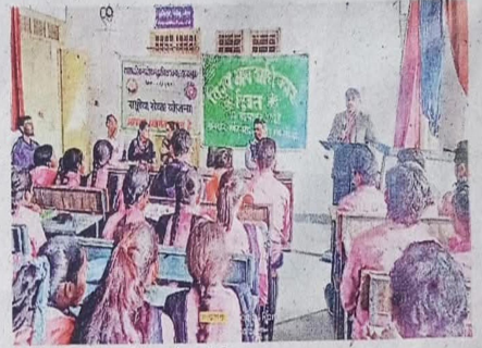
चर्चा में शामिल छात्र एवं छात्राएं