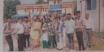
कलश यात्रा निकालती महाविद्यालय के छात्र-छात्राएं