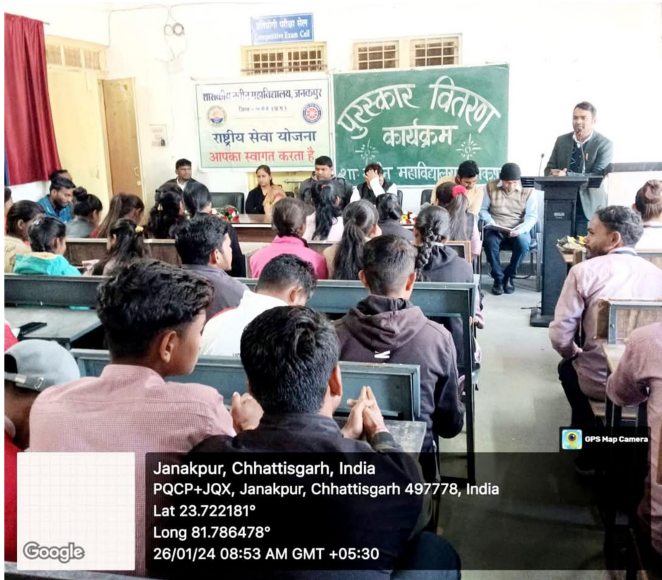
Janakpur, Chhattisgarh, India PQCP+JQX, Janakpur, Chhattisgarh 497778, India Lat 23.722181° Long 81.786478° 26/01/24 08:53 AM GMT +05:30

संत गहिरा गुरु विश्वविद्यालय, सरगुजा, अम्बिकापुर से संबद्ध Website-janakpurcollege.ac.in Mo. No. 9415248896 Email- gndc.jnk2008@gmail.com