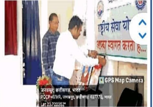
महात्मा गांधी की फोटो में माल्यार्पण करते शिक्षक