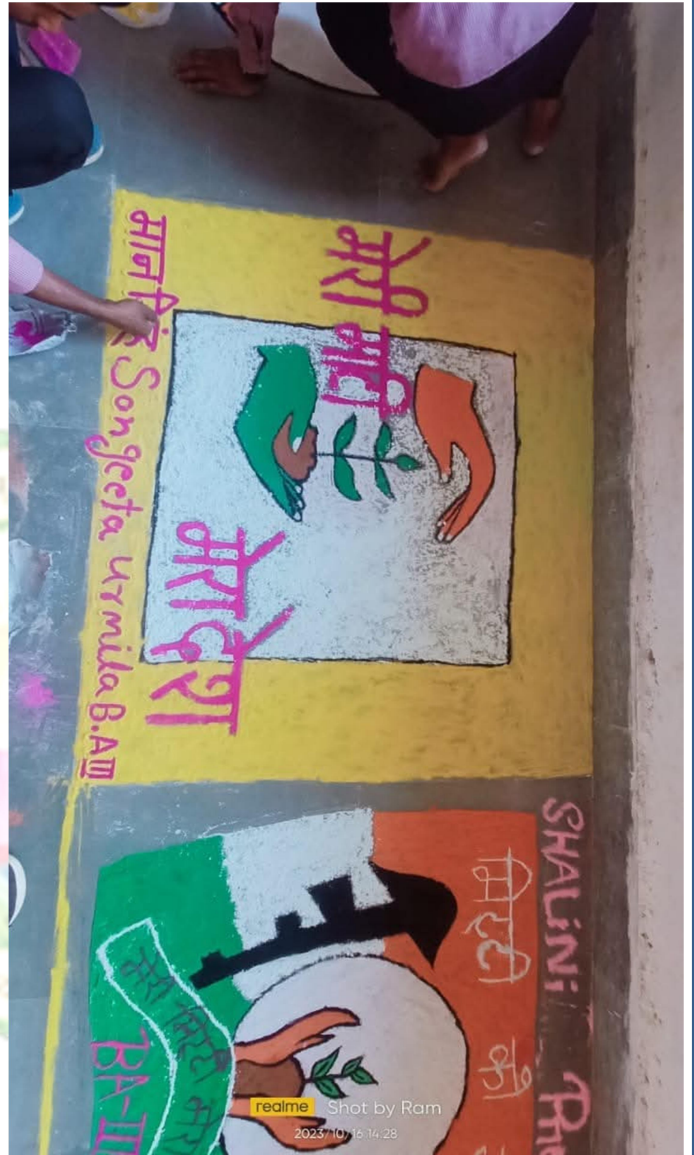
realme Shot by Ram 2023/10/16 14:28