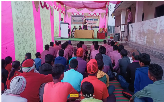
realme 2024/07/26 10:00