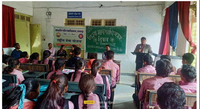
realme 2024/07/26 10:00