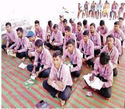
रासेयो शिविर मे जानकारी लेते विद्यार्थी