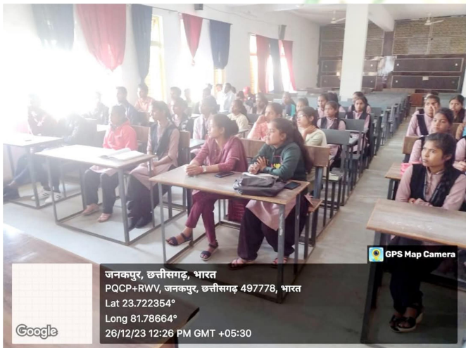
जनकपुर, छत्तीसगढ़, भारत PQCP+RWV, जनकपुर, छत्तीसगढ़ 497778, भारत Lat 23.722354° Long 81.78664° 26/12/23 12:26 PM GMT +05:30