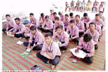
रासेबे शिबिर मे जानकारी लेते छात्राओं का वीडियो